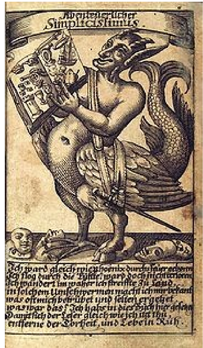
H.J.C. v. Grimmelshausen: Der Abentheurliche Simplicissimus Teutsch Titelblatt und Frontispiz der Erstaussgabe (1669)