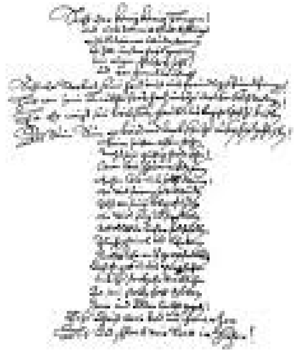
Catharina Regina von Greifenberg: Kreuzgedicht