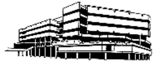
Universitätsbibliothek Freiburg i.Br.

Position: Diplom-Bibliothekarin im Dezernat Informationsdienste / Bibliothekarische Koordination Informationstechnik / Monographienbearbeitung